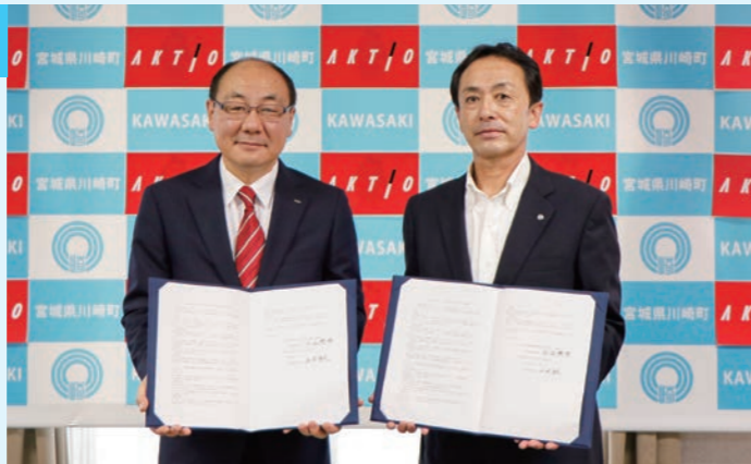
▲写真左から、株式会社アクティオ 小沼代表取締役社長、小山町長

調印式の中で小山町長は「災害時でも行政サービスを行うために必要となる資材、機材を優先して提供いただけることに町民を代表し感謝申し上げます。」と話していました。