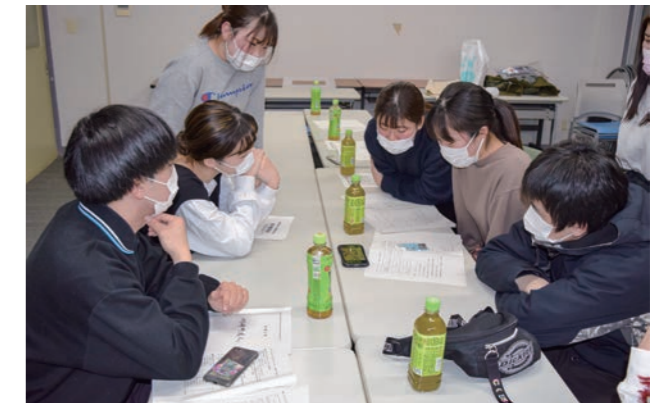
▲成人式の企画を話し合う昨年度の実行委員の皆さん