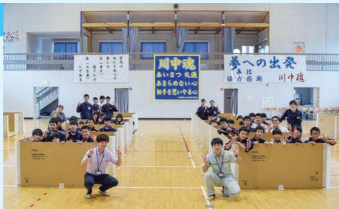
▲「がんばる一む」の組み立てはバッチリ!