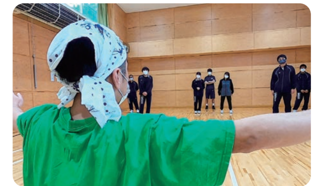
▲熱のこもった稽古の一幕