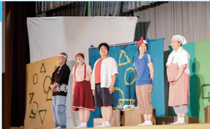
▲「劇団仲間」のキャストの方たち。プロの演技力に圧倒されました。