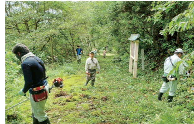
▲史跡整備をする文化財保護委員と町職員

町指定の文化財である阿古耶の松、花館の一里塚、古関跡、有耶無耶の関、仙住寺跡がきれいになり見学しやすくなりました。