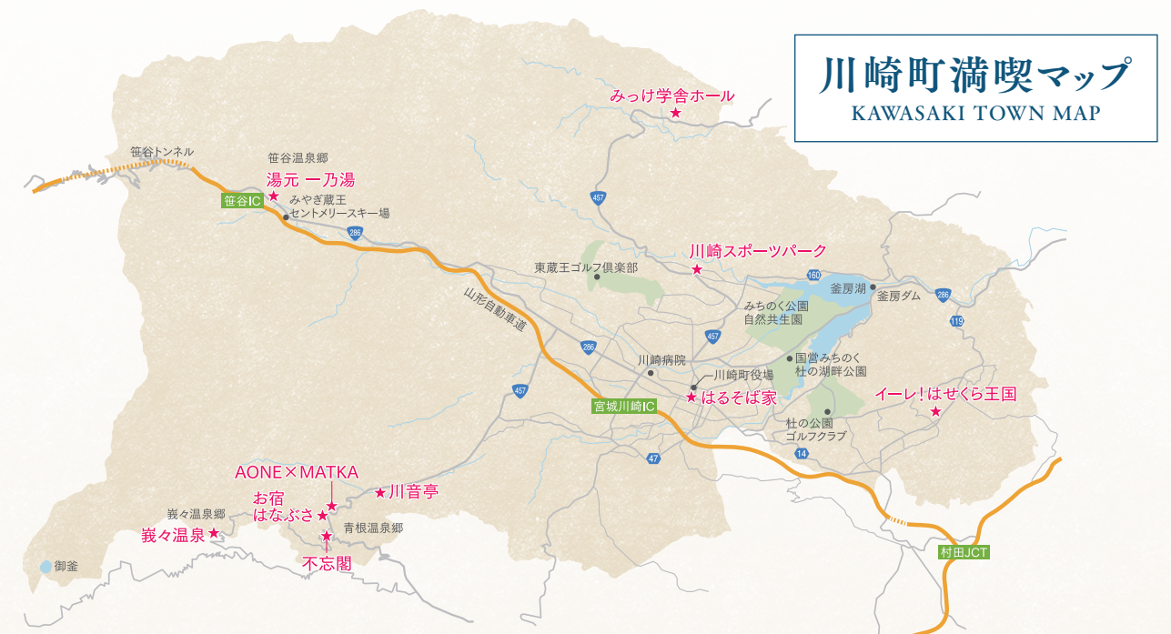
川崎町満喫マップ KAWASAKI TOWN MAP