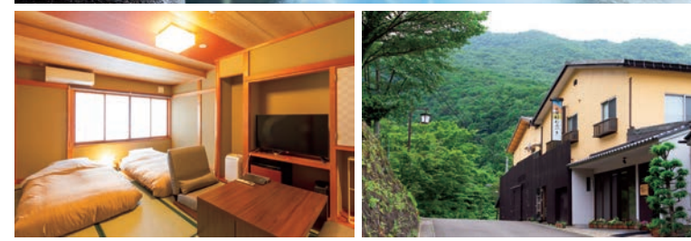
四季折々の景色を堪能できる露天風呂が魅力の宿。客室は洋室、和室などのタイプがある。写真(下・左側)は畳敷きにローベッドの落ち着いた雰囲気のある部屋