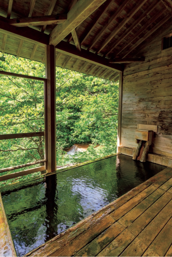
山と川の景色に溶け込んだ一軒宿。木造りが心地よい天空の湯(上)や間近に川を眺める混浴露天風呂(右上・左側)、内湯がある