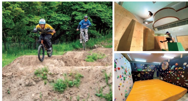
旧川内小学校を利用した施設。パルクール(右上)、ボルダリング(右下)、自転車コースなど、多彩なスポーツができる