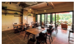
旧支倉小学校を利用した施設。レストランではカカオ入りオムカレーなどカカオを使ったメニューが魅力