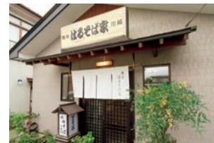
上/川崎産そば粉100%のすずしろそば。千切り大根、天玉、ワカメを添え、歯ごたえの違いを楽しむ一品 左/川崎の街中にある店舗