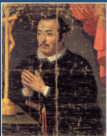
1615年、ローマで制作されたとみられる支倉常長の肖像画（ユネスコ記憶遺産・国宝 仙台市博物館蔵）