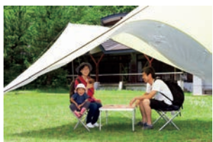
旧前川小学校青根分校を利用した施設。「校庭」ではキャンプもでき、様々なアクティビティが楽しめる