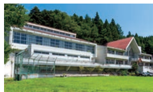
旧日本砂金小学校を利用した施設。レストランの一番人気は大ぶりな牡蠣たっぷりのカキフライ定食。新メニューにマコモラーメンが加わる予定だ。ラウンジにはセラミック温熱機器の足湯も