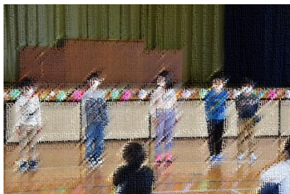
一年生を迎える会