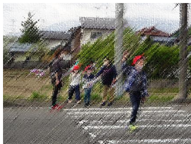
交通安全教室(低学年)