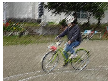
交通安全教室(高学年)