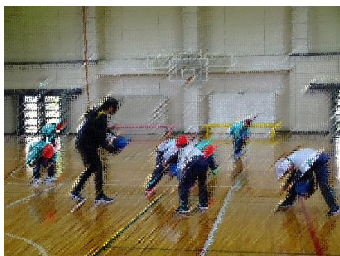
授業参観(3・4年体育)