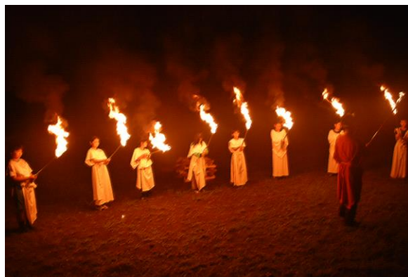
【5年生キャンプファイヤー】

各学年で体験活動を通して、たくさんの方々と出会い、考えを深めることができました。