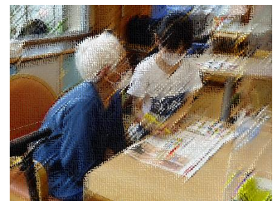
1・2年の高齢者施設訪問