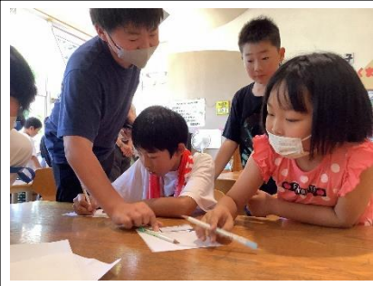
富小チャレンジランキング