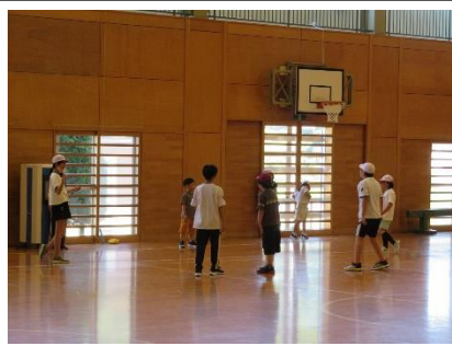
業間たてわり遊び