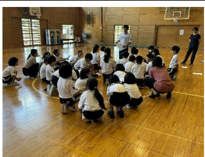
えずこキャラバン