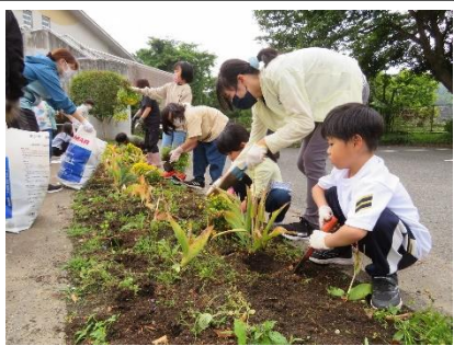
たてわり活動「球根掘り」