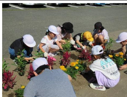
たてわり活動「花の苗植え」