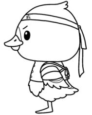
みやぎハローワークキャラクター 「カンちょーさん」