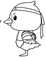
みやぎハローワークキャラクター 「カンちょーさん」