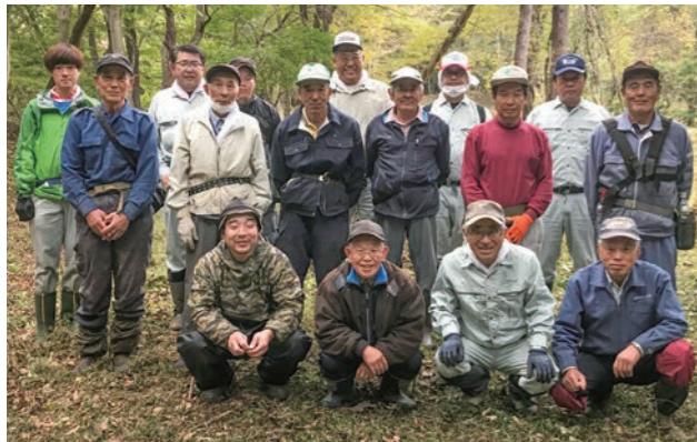
▲前川地区の方々や文化財保護委員の皆さん

10月21日、前川本城の整備を地域の方々や文化財保護委員、町職員が行いました。この城跡は14年続けて整備をしており、戦国時代の姿がそのまま残されています。見やすい技巧的な城跡として全国的に有名になり、一年中見学者が訪れます。