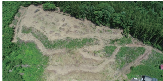
▲小野城跡の航空写真