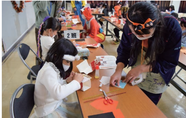
▲お菓子の入れ物づくり

10月25日、川崎町公民館でジュニア・リーダーハロウィンパーティーが開催され、町内の小学生30名、ジュニア・リーダー9名が参加しました。当日は、毎月の定例会でジュニア・リーダーが企画してきた「お菓子の入れ物づくり」や「宝探し・ゲーム」などを楽しみました。