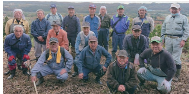
▲「小野城跡を守る会」の方々と文化財保護委員の皆さん

また、25日は小野城でも、地域の方々による「小野城跡を守る会」や文化財保護委員、町職員が連携し、整備活動を行いました。本丸跡から見える釜房湖、みちのく杜の湖畔公園、蔵王連峰は絶景です。