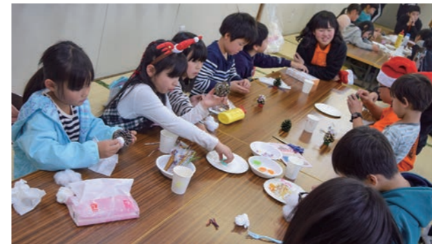
▲松ぼっくりツリーづくり

参加希望者は、各小学校に配布したチラシに必要事項を記入の上、直接公民館へ提出してください。