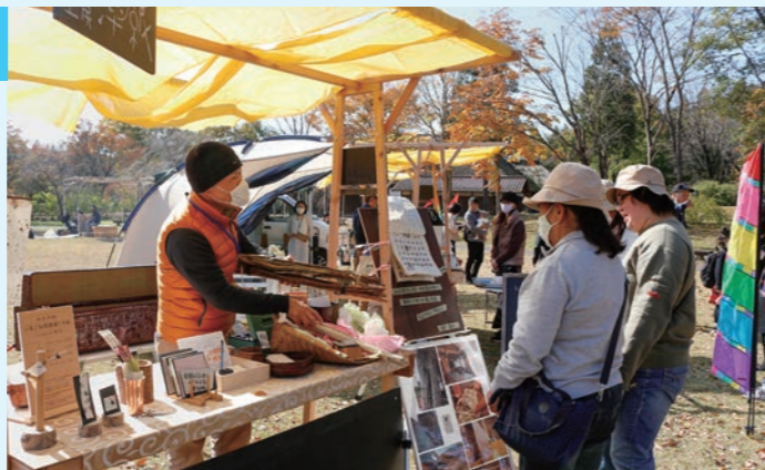
▲お客さん、思いのこもった作品いかが？

10月31日・11月1日、みちのく杜の湖畔公園でカワサキキャラバンが開催されました。こだわりのコーヒーやハンバーガーなどのグルメから、ろうそくや木工品、和紙、雑貨など、川崎町で活動する方たちの出店が集結しました。