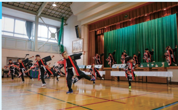
▲保護者や地域の方に見守られ元気いっぱいに踊りました。

10月17日、前川小学校で最後の学芸会が開催されました。青根分校から引き継いできた「前川よさこい」で始まり、各学年ごとに、ハロウィンにちなんだ劇やスイミーの音楽劇、普段気付かない川崎町や前川地区の良さを再発見させてくれるオリジナルの劇や替え歌を披露しました。最後は、5・6年生が校歌斉唱ではなく、新型コロナウイルス感染症感染予防に配慮し、ハンドベルで校歌を演奏しました。