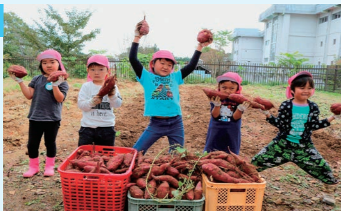
▲大きなさつまいも、ほったど～！

10月22日、かわさきこども園の年長組が、こども園の「にこにこ農園」でさつまいもの収穫を行いました。このさつまいもは5月に定植し育てたもので、大きく育ったさつまいもに、子供たちは大興奮していました。